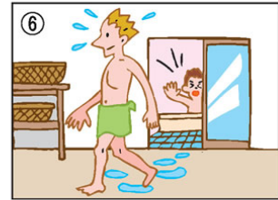
脱衣所へ上がる前に、体を拭いてください。