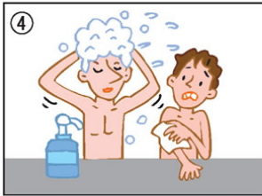
体を洗うときは、他の人に迷惑がからないように。