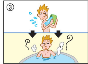
浴槽に入る前に体を洗いましょう。