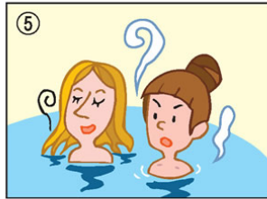
浴槽に髪の毛を浸けないでください。