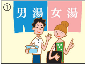
男湯と女湯があります。